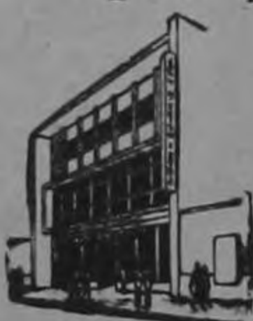
Fundado en 1925